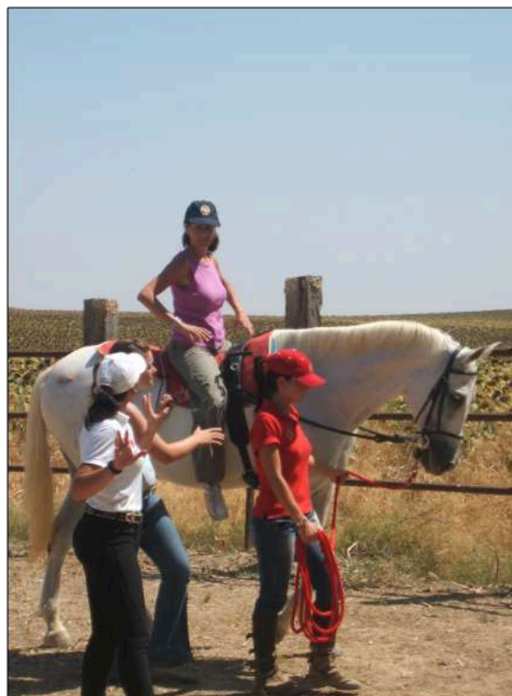
Disfrutando de una sesión de hipoterapia.

Comprendí que, a menudo, el poder de la mente y la actitud pueden desempeñar un papel significativo en la recuperación y el bienestar. Esta comprensión me inspiró a explorar nuevas formas de ayudar a las personas a aprovechar su potencial, superar obstáculos y alcanzar sus metas en la vida.