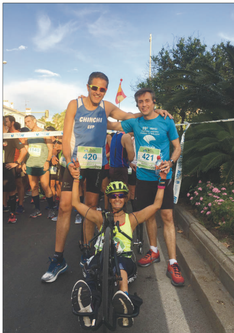
Media Maratón de Marbella en handbike con mis hermanos.