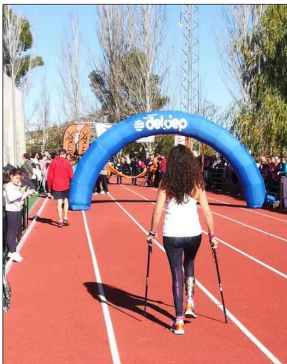
Carrera Popular de Priego de Córdoba.

De querer ser la mejor veterinaria de caballos de España, a ayudar a personas en su crecimiento personal y laboral. De médico de animales de 4 patas a mentora de comunicación de animales racionales de 2 patas. Nuevos desafíos sin “la bata”.