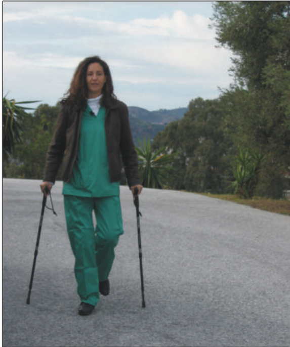
Jornada laboral ejerciendo como veterinaria equina.

Volver a caminar, casarme, tener hijos, una casa, un coche, cursar un Máster MBA, viajar por el mundo y ser veterinaria de la ganadería del Burro Andaluz. Yo decidí reescribir el guión de mi vida durante mi rehabilitación. Y algo que parecía inalcanzable, se hizo realidad. Descolgar la bata de la percha, para ser la gerente de mi propia clínica de pequeños animales en 2008 (37 años).