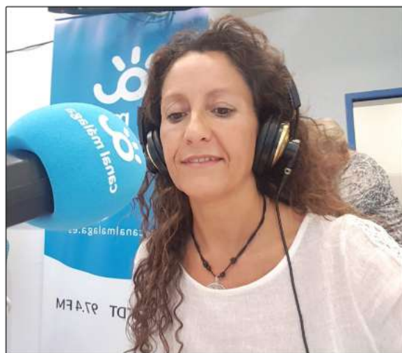
Compartiendo mi experiencia durante una entrevista en la radio con Canal Málaga.

Mi sueño de crear un centro especializado de reproducción equina, se quedó en eso, en un sueño. Pero, ¿quién sabe? Ninguna herida es un destino y yo decido seguir soñando. La vida no admite ensayos, pero sí nos permite soñar muy alto y a veces los sueños, se hacen realidad.