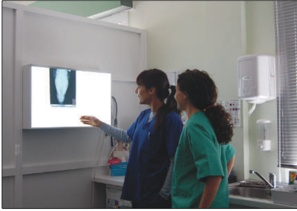
Con mi socia revisando un caso en la Clínica Veterinaria Amik.