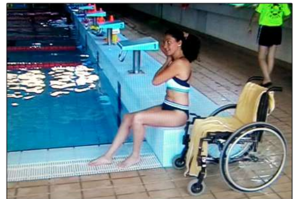
Sesiones de rehabilitación en la piscina de Torremolinos.