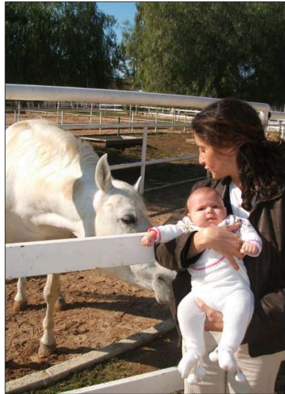
Siempre he tratado de inculcar a mi familia el amor por los animales.